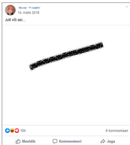
Pilt 1. Jutt või asi...